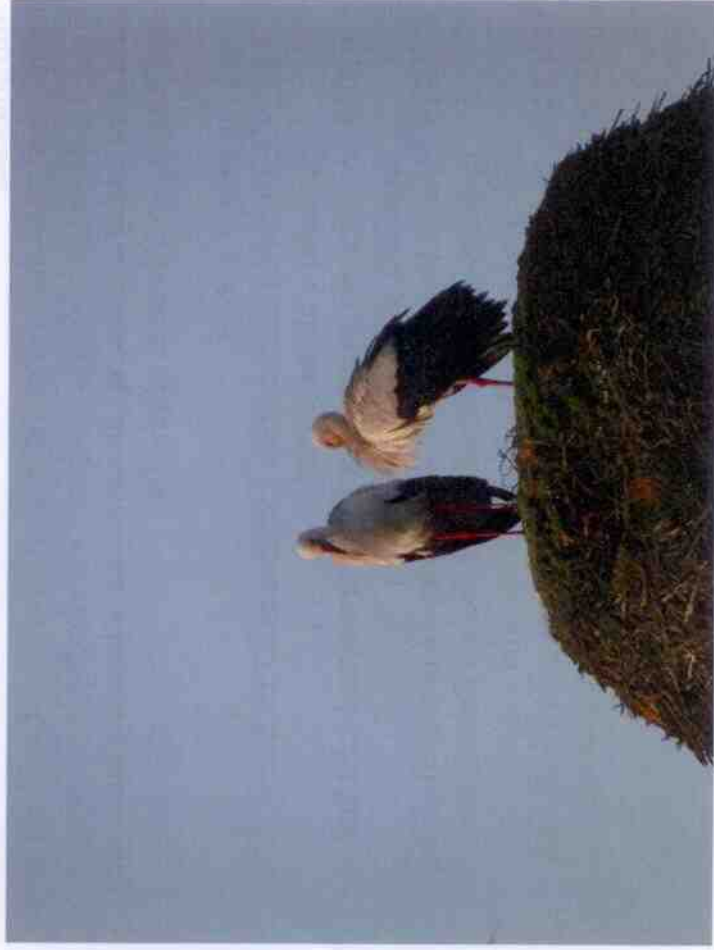
obec Dírna, 2018